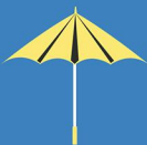
ทำร่มด้วยผ้า หรือกระดาษ