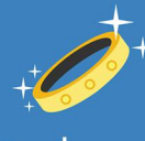
ทำเครื่องทอง เงิน นาค