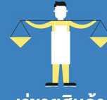
เร่ขายสินค้า