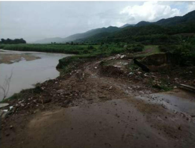
กองช่าง อบจ.แม่ฮ่องสอน นำเครื่องจักรกลและพนักงานขับ ออกปฏิบัติงานขุดลอกคลองส่งน้ำหนองปุดัง บ้านคอนฝิ่ง หมู่ที่ 5 ตำบลแม่คะตวน อำเภอสบเมย จังหวัดแม่ฮ่องสอน ระหว่างวันที่ 17 - 26 มิถุนายน 2565