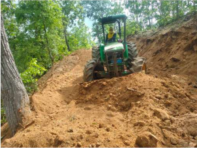
กองช่าง อบจ.แม่ฮ่องสอน นำเครื่องจักรกลและพนักงานขับ ออกปฏิบัติงานปรับปรุงซ่อมแซมถนนลูกรังที่ชำรุดเสียหาย สายวัดพระธาตุศรีวิชัย - ในปิง ตำบลแม่ฮี้ อำเภอปาย จังหวัดแม่ฮ่องสอน ระหว่างวันที่ 15 - 18 มิถุนายน 2565 ที่ผ่านมา