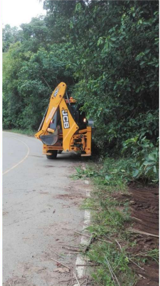
กองช่าง อบจ.แม่ฮ่องสอน นำเครื่องจักรกลและพนักงานขับ ออกปฏิบัติงานซ่อมบำรุงถนนสาย มส.ถ 1-0009 บ้านห้วยหยวก - บ้านแม่โถกกลาง และ ถนนสาย มส.ถ. 1 - 0010 บ้านแม่โถกกลาง - บ้านขุนแม่ลาน้อย ตำบลแม่โถ อ.แม่ลาน้อย ระหว่างวันที่ 15 - 24 มิถุนายน 2565