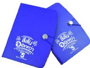
"สมุดโน้ต"