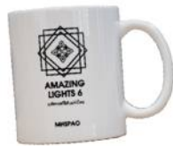
"แก้วน้ำเซรามิค"