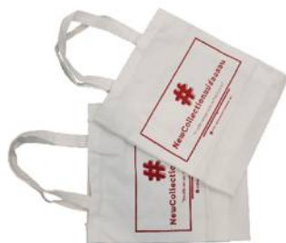
"กระเป๋าผ้า"

Radio : อบจ.เพื่อชุมชน FM 99.5 MHz ทุกวัน จ - ศ เวลา 16.00 - 16.30 น. อบจ.แม่ฮ่องสอนพบประชาชน FM 104 MHz อบจ.แม่ฮ่องสอนพบประชาชน FM 90.5 MHz ทุกวันอังคาร เวลา 10.10 - 11.00 น.