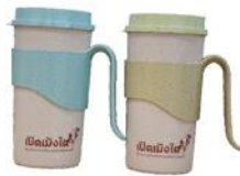
"แก้วน้ำพลาสติก"