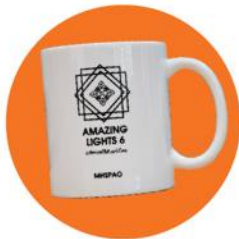
"แก้วน้ำเซรามิค"