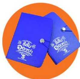
"สมุดโน้ต"