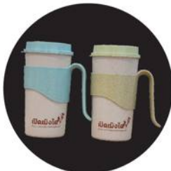
"แก้วน้ำพลาสติก"