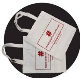
"กระเป๋าผ้า"